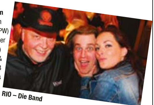
RIO – Die Band